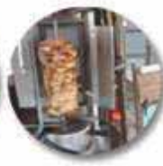
ハンビー プライマーマーケット