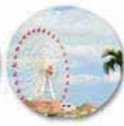
カーニバルパーク ミハマ